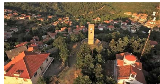
Αεροφωτογραφία του Κοινοτικού Ωρολογίου

Ενημερωτικό Δελτίο του Συνδέσμου των Απανταχού Καρυατών